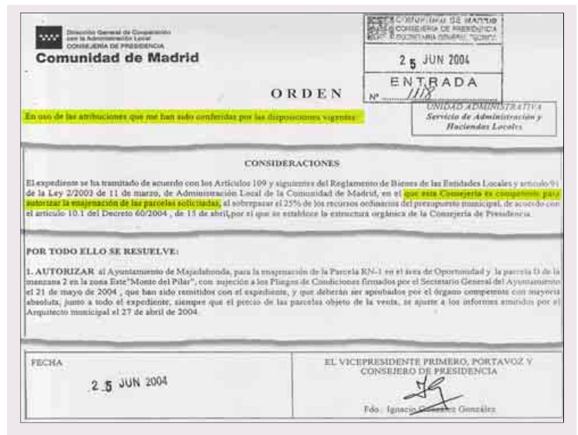
Orden de Ignacio González de junio de 2004, que autoriza la venta de terrenos en Majadahonda.